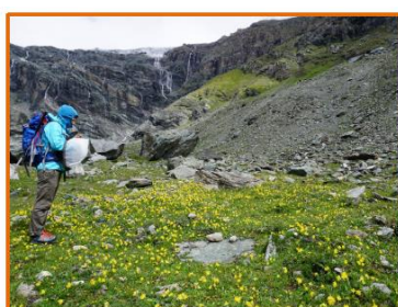
1. Transekt einrichten